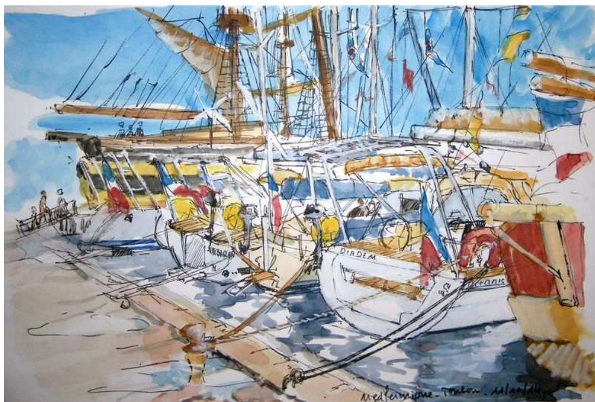
Dessin Jacques Gautier

NB : Ce n'est qu'à compter du lundi 3 novembre que sera diffusée la situation des bateaux sur Google Earth