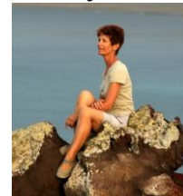
Embarquée à bord de Philéas

Précisions complémentaires sur les repas langoustes d'Eric et Hélène ou pour découvrir l'île de Santo Antao sur le site de PHILEAS