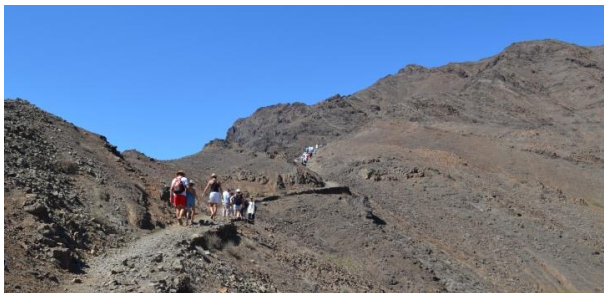
Séance de remise en forme

maïs, des haricots, des fèves, des carottes, de la viande de porc, du boudin, du poisson, des patates douces, de la courge, du manioc, notre cachupa est très riche en ingrédients et ...en calories !