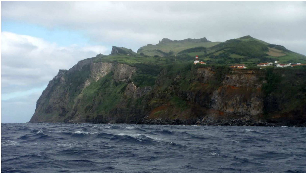
ATTERRISSAGE SUR FLORES